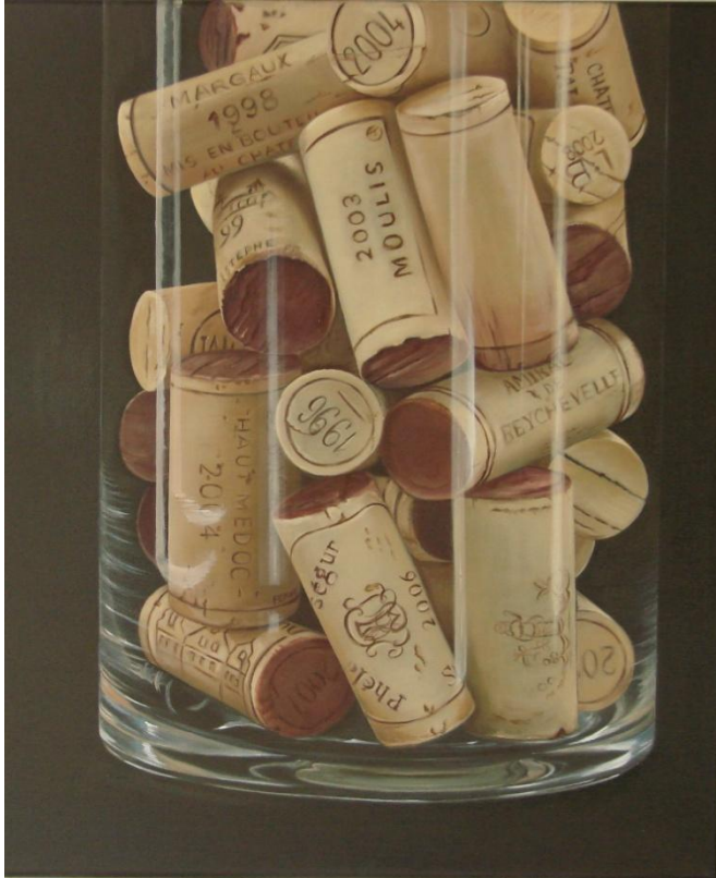
Bouchons d'excellence Primé au Salon ART CAPITAL Grand Palais

Passionnée pour les techniques de peinture en trompe l'œil avec un désir de recréer la réalité de toute matière, objets, dès le premier coup d'œil, un art très difficile mais quelle satisfaction de maîtriser cette illusion.