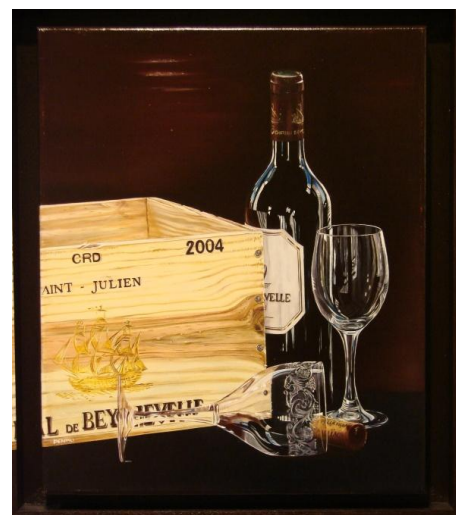
Secret du palais