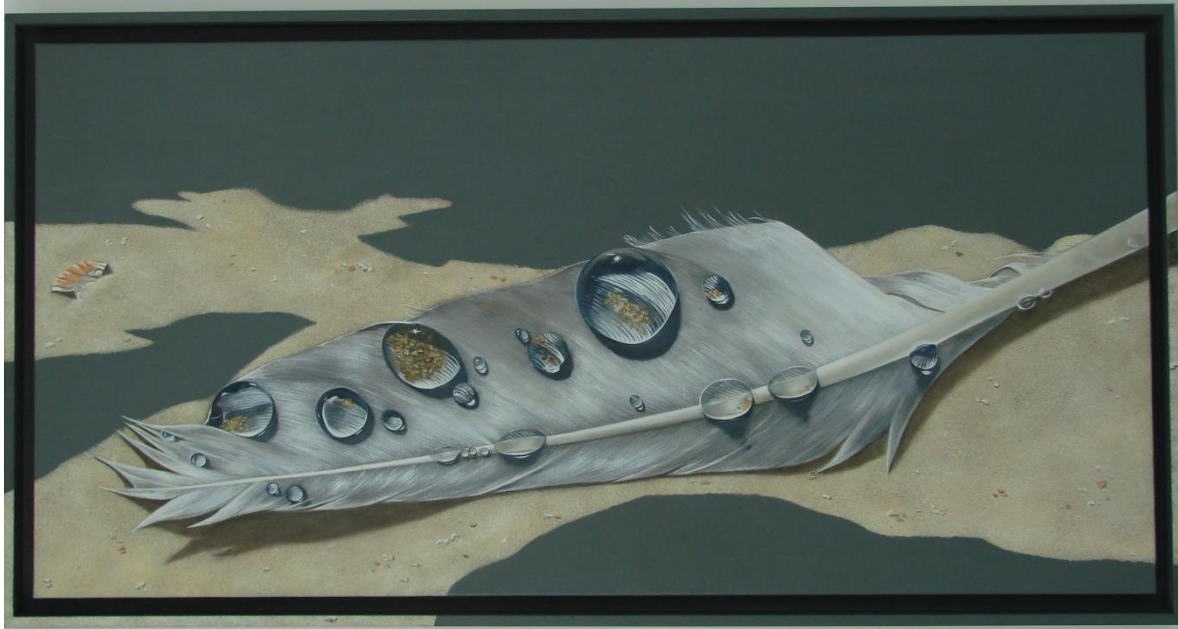
Parenthèse sur la baie