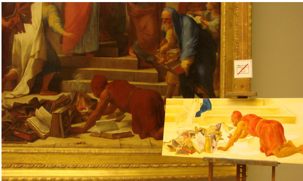
Prédication de st Paul de LESUEUR