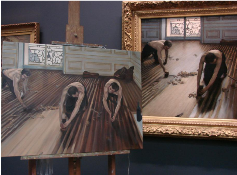
Les raboteurs de CAILLEBOTTE