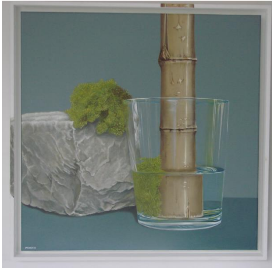
Pavé de verre