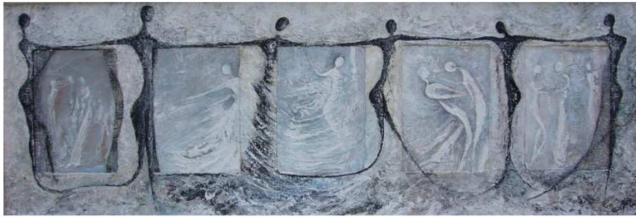
Chaîne de Solidarité

Jeux de lumières, de matières et de couleurs, chacune de ses peintures est le chemin d'une expérience personnelle.